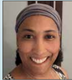
Escrito por el doctor Ardis C. Martin, M.D. True InSight Psychiatric 1407 Oakland Blvd., Suite 300 Walnut Creek, CA 94596 trueinsightpsychiatric.com

Escrito por el doctor Ardis C. Martin, M.D.